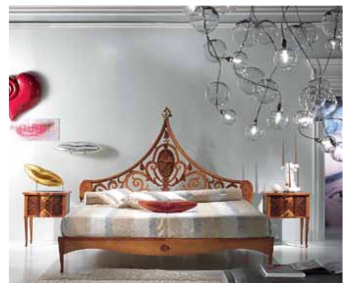
В гарнитуре Sissi от Sagranelli привлекает ювелирная работа краснодеревщика. Узоры скомпонованы из разной древесины: палисандра, бриара, ореха и красного дерева

Одеваемые на каркас элементы, в том числе декоративные, могут быть из фанеры, из MDF или ДСП, из массива