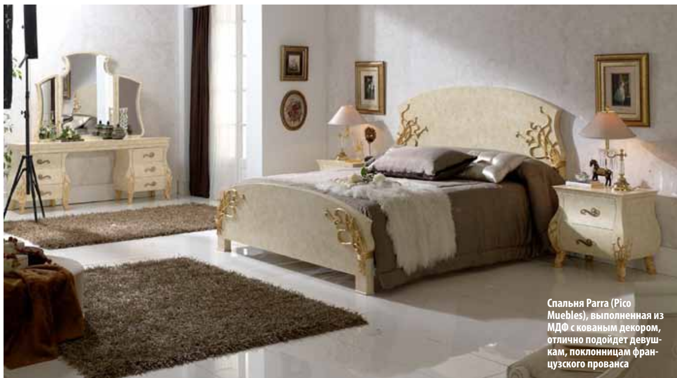
Спальня Parra (Pico Muebles), выполненная из МДФ с кованым декором, отлично подойдет девушкам, поклонницам французского прованса