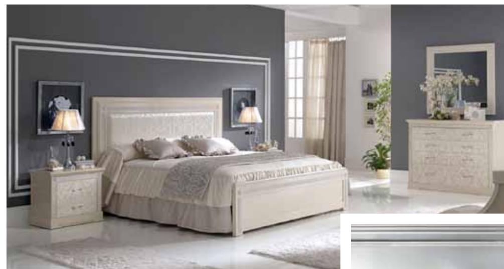
Нежные кремовые оттенки гарнитура Vaikal от Pico Muebles с глянцевым узором по крашеному дереву и атласному изголовью наиболее выигрышно смотрятся на темном фоне

го механизма мгновенно откроет доступ к недрам-хранилищам, а количество ножек при металлическом каркасе может сократиться до двух, не говоря уже о наличии/отсутствии спинок. Важно, что металлический каркас как с решеткой, так и с ламелями обладает ортопедическим эффектом. Именно за такую конструкцию «голосуют» производители матрасов.