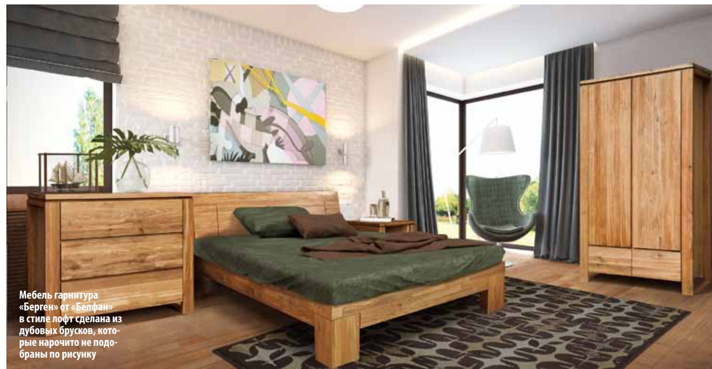
Мебель гарнитура «Берген» от «Белфан» в стиле лофт сделана из дубовых брусков, которые нарочито не подобраны по рисунку

В основании кровати может быть цельнометаллическая конструкция с решеткой, металлическая рама с деревянными ламелями, каркас из натурального дерева с ламелями или настилом, корпус из фанеры или ДСП. Прочность металла позволяет каркасу быть достаточно тонким и прочным, функциональным и конструктивным. Так, наличие подъемно-