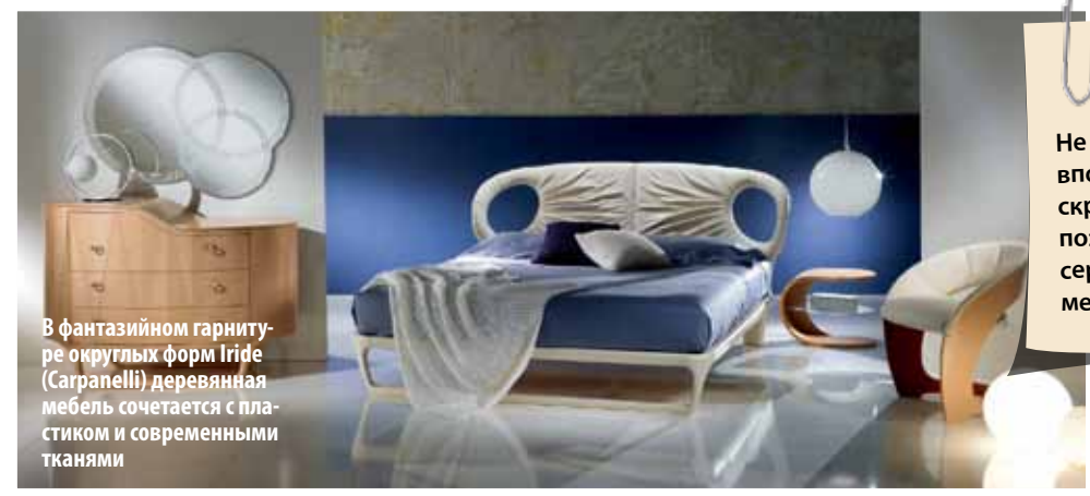
В фантазийном гарнитуре округлых форм Iride (Carpinelli) деревянная мебель сочетается с пластиком и современными тканями

Справка Не сертифицированная продукция вполне может представлять скрытую угрозу вашему здоровью, поэтому обязательно требуйте сертификаты соответствия на мебельные материалы