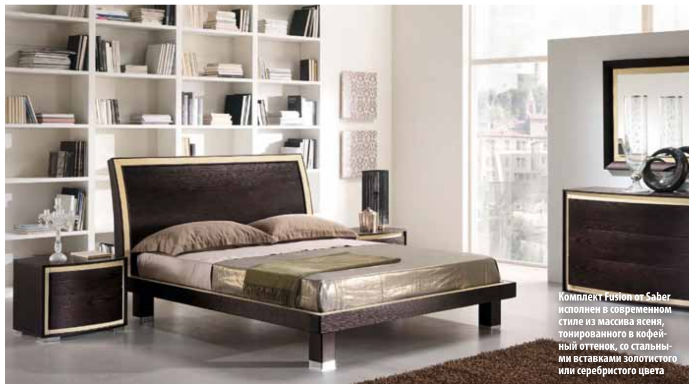
Комплект Fusion от Saber исполнен в современном стиле из массива ясеня, тонированного в кофейный оттенок, со стальными вставками золотистого или серебристого цвета

Модульный принцип шкафов позволяет комбинировать секции в нужных количествах и произвольной последовательности