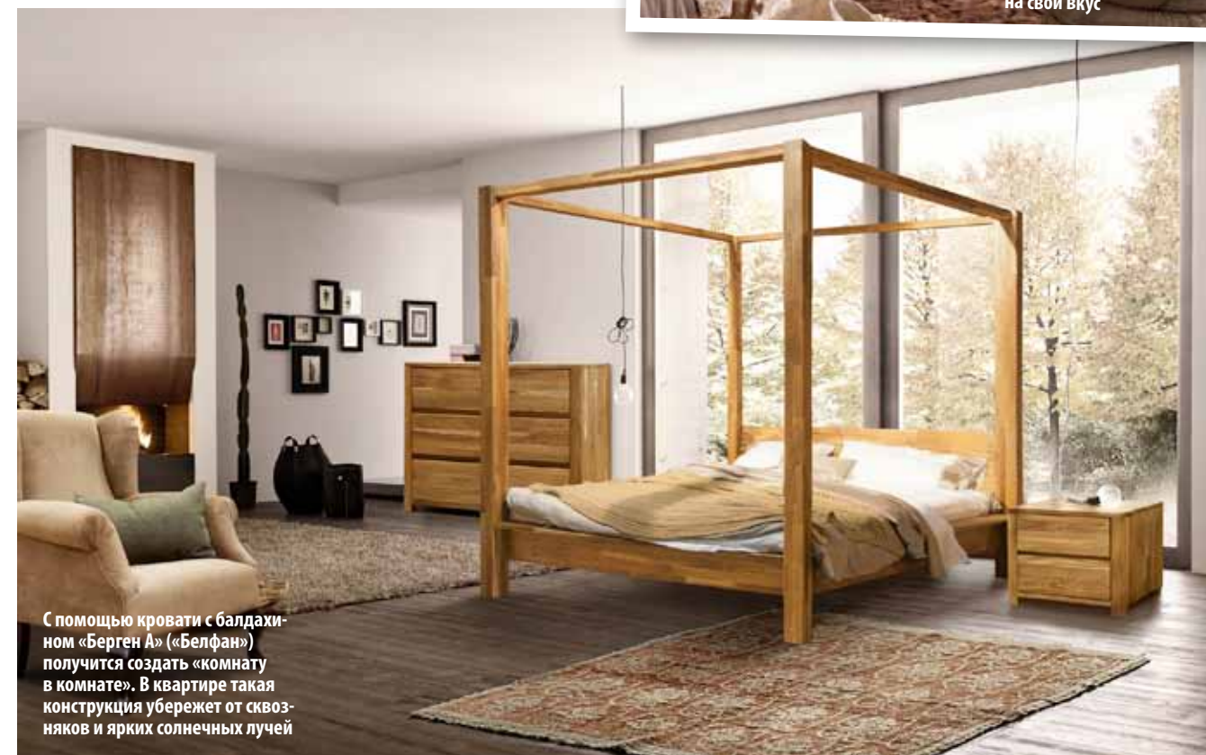
С помощью кровати с балдахином «Берген А» («Белфан») получится создать «комнату в комнате». В квартире такая конструкция уберезет от сквозняков и ярких солнечных лучей

→ совет специалиста Обтянутое тканью, кожей или слегка выгнутое деревянное или из MDF изголовье способствует нормальному положению тела при чтении, продлевает жизнь отделочным материалам стен. Зачастую его оборудуют парой светильников, полочками или дополнительными хранилищами.