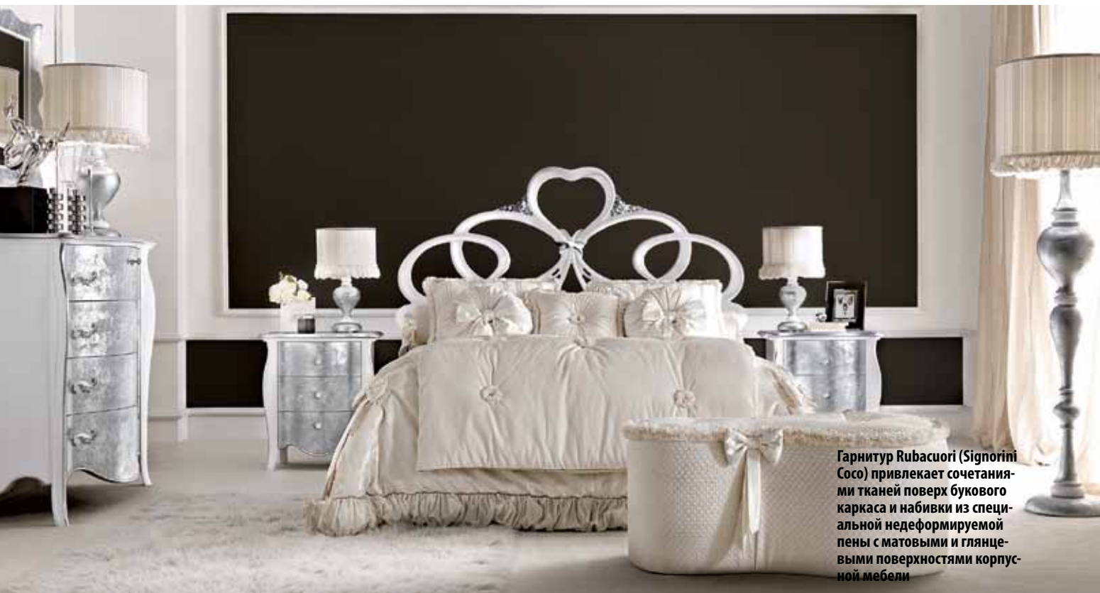
Гарнитур Rubacuori (Signorini Soso) привлекает сочетаниями тканей поверх букового каркаса и набивки из специальной недеформируемой пены с матовыми и глянцевыми поверхностями корпусной мебели