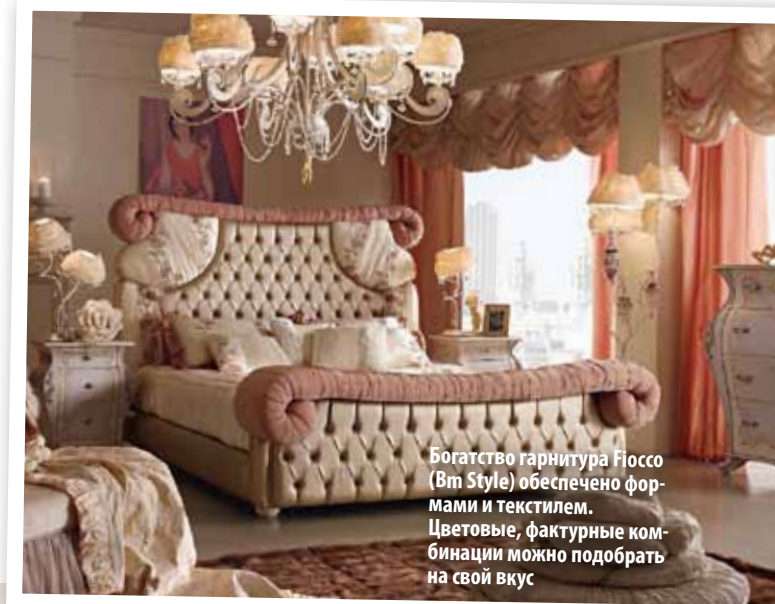
Богатство гарнитура Fiosco (Bm Style) обеспечено формами и текстилем. Цветовые, фактурные комбинации можно подобрать на свой вкус

В производстве корпусной мебели, независимо от стиля (и не только мебели для спальни), применяют современные композитные материалы. В отличие от натурального дерева они не подвержены короблению от перепадов температуры и влажности, а варианты их декорирования весьма широки. Каркасы мебели в основном производят из