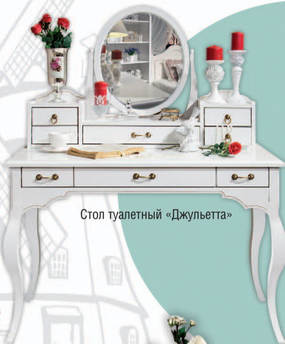
Стол туалетный «Джульетта»

Нежные и романтические аксессуары способны создать в Вашем доме настоящее волшебство. В окружении таких вещей игривое настроение Вам обеспечено!