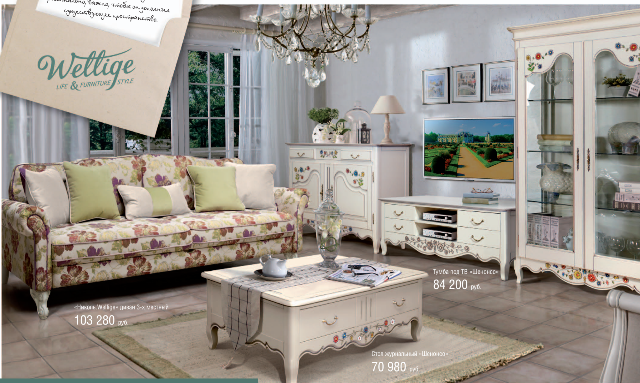
«Николь Wellige» диван 3-х местный 103 280 руб.