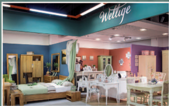
Wellige, ТЦ «4комнаты»