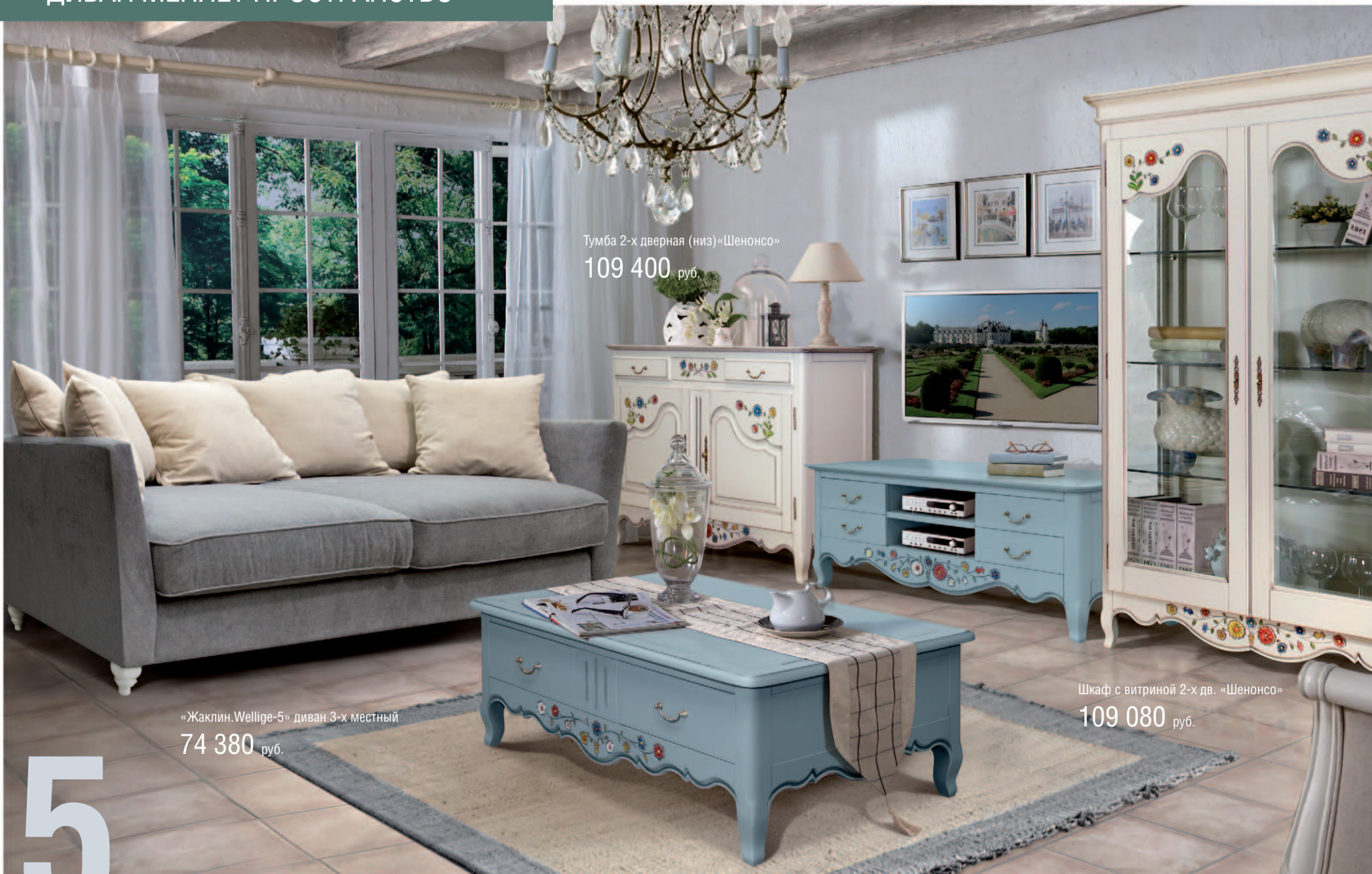
Тумба 2-х дверная (низ) «Шенонсо» 109 400 руб.