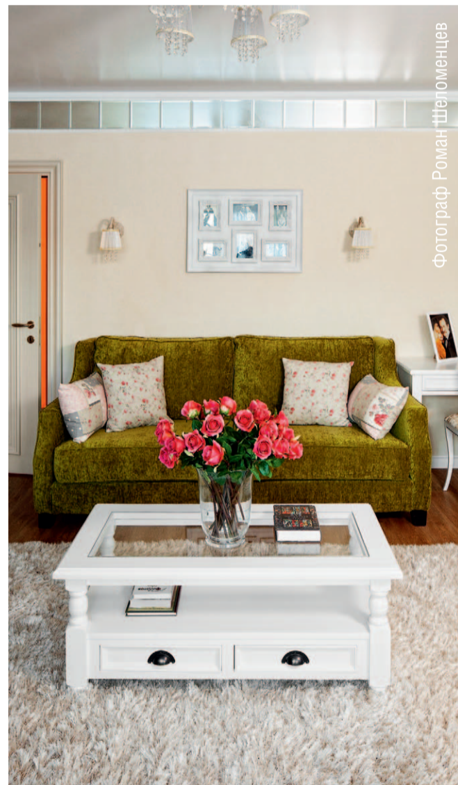
Фотограф Роман Шегоменцев