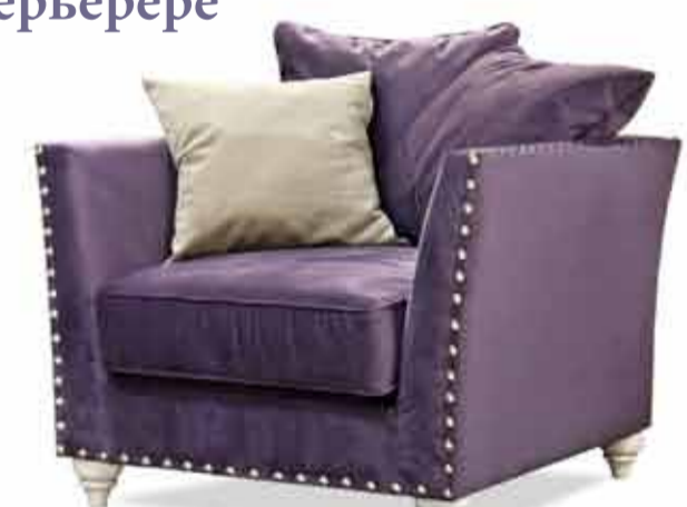
«Жаклин-4» кресло от 46 180 руб.

Прекрасный способ полностью обновить интерьер – поменять надовешную обивку кресла. А лучше приобрести новое кресло, которое будет не только модным акцентом в интерьере, но уютным дополнением к спальне